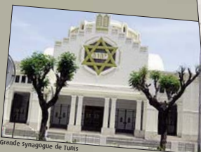
Grande synagogue de Tunis