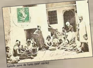
Famille juive de Tunis (XIX e siècle)