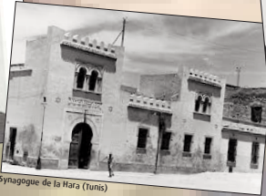
Synagogue de la Hara (Tunis)