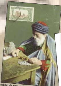
Rabbin du XIX e siècle