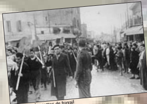
Départ pour les camps de travail