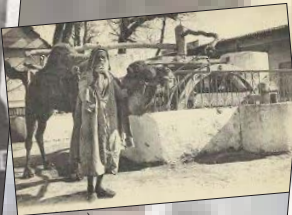
Saf-Saf (La Maita)