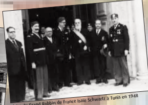
Visite du Grand Rabbin de France Isaac Schwartz à Tunis en 1948