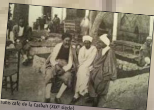
Tunis café de la Casbah (XIX e siècle)